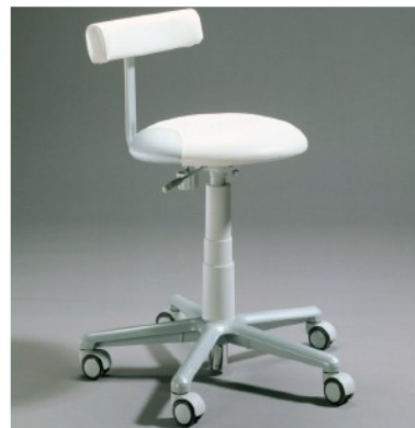
Untersuchungsstuhl mit Lehne